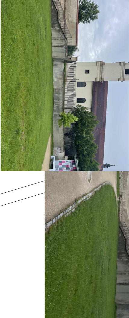
FOTO – STÁVAJÍCÍ STAV